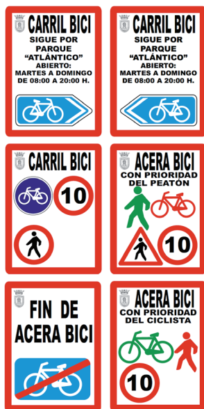
Anexo III. Catálogo de vías e itinerarios ciclistas